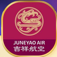
JUNEYAO AIR 吉祥航空

เที่ยวสุดคุ้มไม่ลงร้านรัฐบาล ล่องเรือชมเมืองโบราณ เดินชิลริมน้ำย่านเดอะบันด์