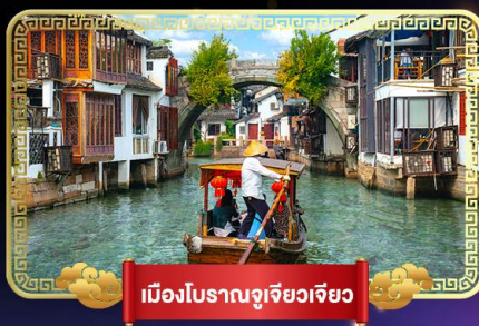
เมืองโบราณจู่เจียจิว