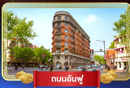
ถนนอันฟู